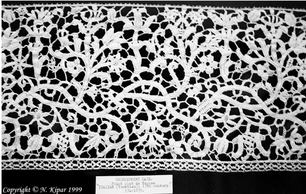
Knipling fra Venedig, 1700-tallet.